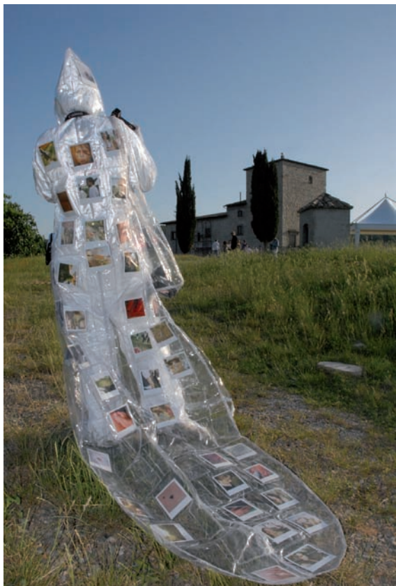
Impermeabile performance nomade, 2004-2009, plastica trasparente e polaroid, tuta in PLP, mascherina, guanti lattice